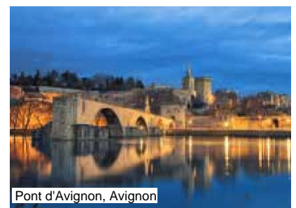
Pont d'Avignon, Avignon