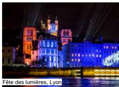
Fête des lumières, Lyon