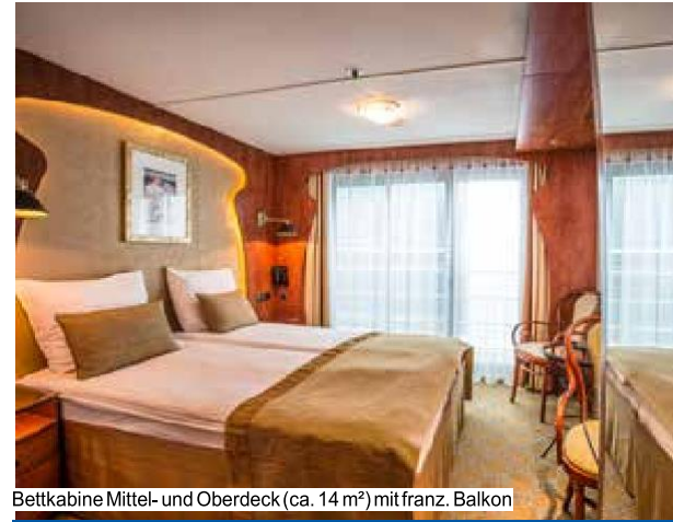
Bettkabine Mittel- und Oberdeck (ca. 14 m 2 ) mit franz. Balkon