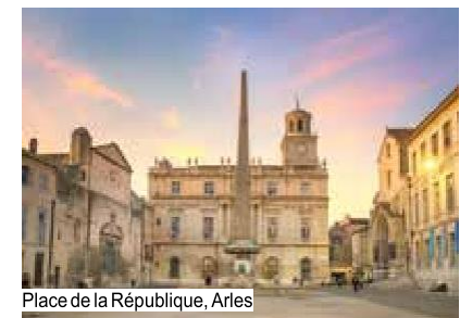
Place de la République, Arles