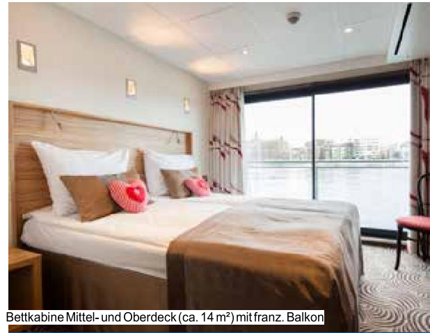
Bettkabine Mittel- und Oberdeck (ca. 14 m 2 ) mit franz. Balkon