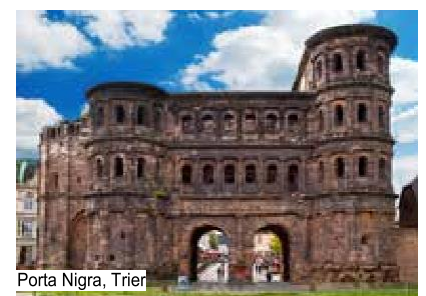
Porta Nigra, Trier