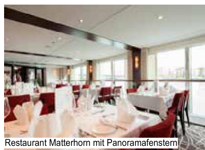
Restaurant Matterhorn mit Panoramafenstern