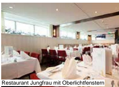
Restaurant Jungfrau mit Oberlichtfenstern